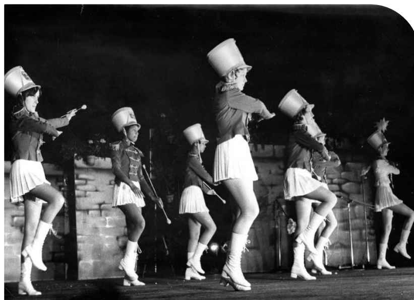
Les majorettes

catholique est créée en 1919 au sein des Filles de la Charité. Cette congrégation religieuse catholique fondée au XVII e siècle par Saint Vincent de Paul et Sainte Louise de Marillac offre un exemple saisissant pouvant contrebalancer la culture habituellement pressentie comme hostile à l'égard des femmes et du sport. Contrairement à un ordre religieux traditionnel, les sœurs ne sont pas cloîtrées et leur vocation est tournée vers le service actif des pauvres et des malades dans la société 9 . Très tôt, ces femmes ont parcouru le monde, investies dans des missions salutaires qui les ont menées bien au-delà des frontières traditionnelles