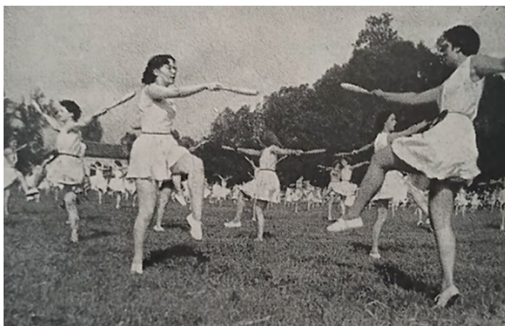
Auxerre – 1955 – Championnat fédéral féminin Exercices d'ensemble aux massues

La formation des cadres est au cœur de toutes les attentions du Rayon Sportif Féminin. La formation morale et spirituelle doit offrir des garanties de bienséance pour que les jeunes filles de France servent à la fois Dieu et leur Patrie. Comment sont formés les cadres du sport catholique féminin ? Les hommes sont-ils autorisés à encadrer les filles, et à quelles conditions ? Le statut de monitrice permet-il d'enseigner au sein des écoles privées. Une histoire des diplômés pourra être engagée en comparaison du développement des autres