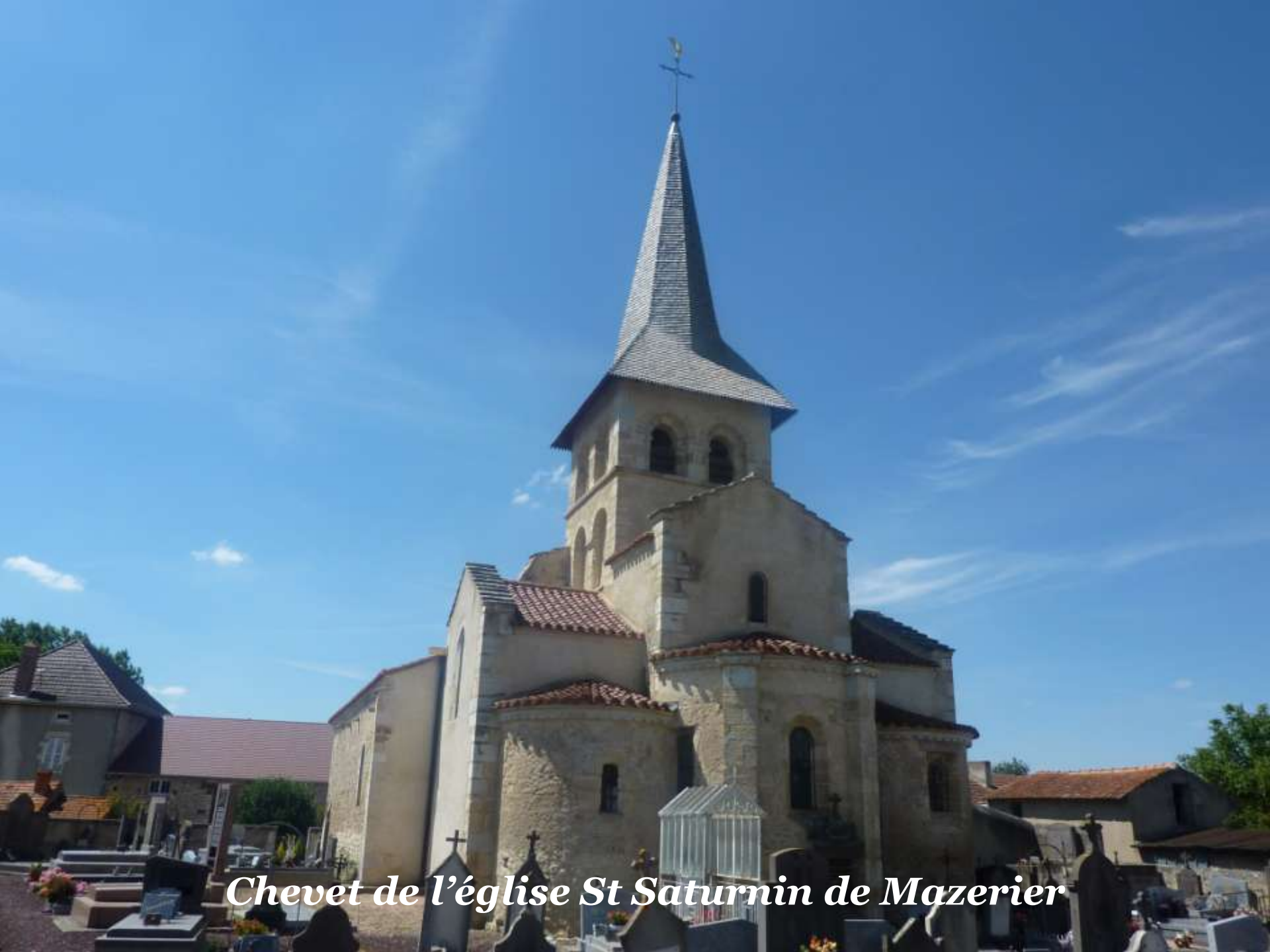
Chevet de l'église St Saturnin de Mazerier