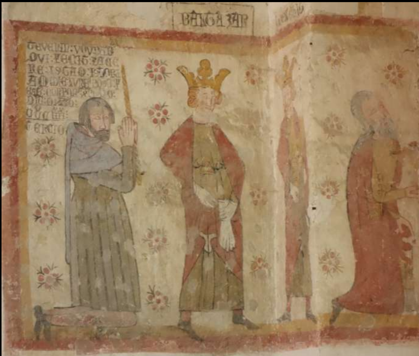
Fresque de l'Adoration des mages, datée 1383