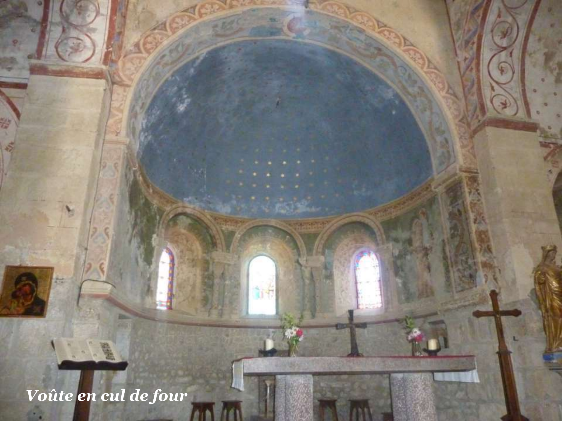
Voûte en cul de four