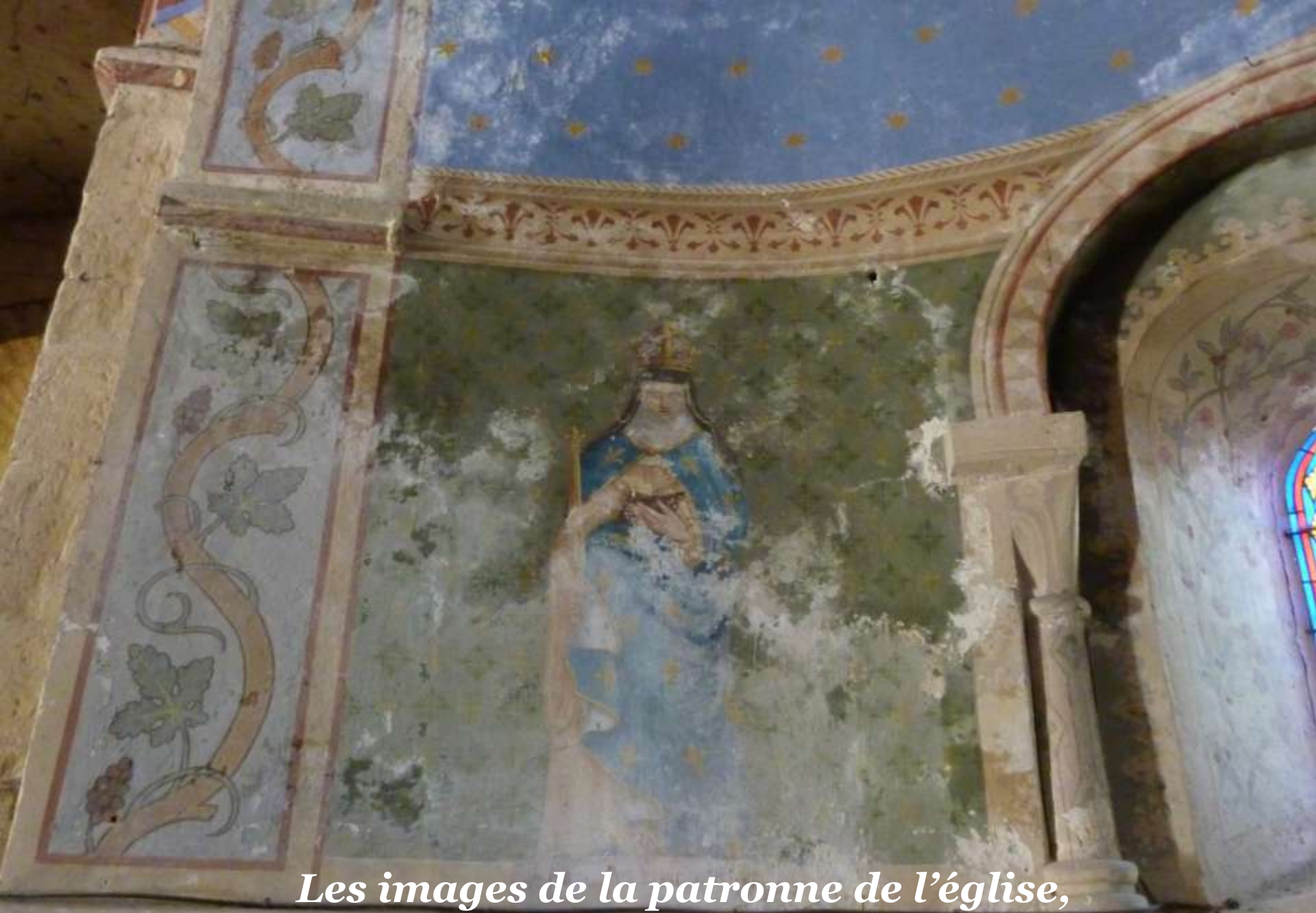
Les images de la patronne de l'église, Ste Radegonde