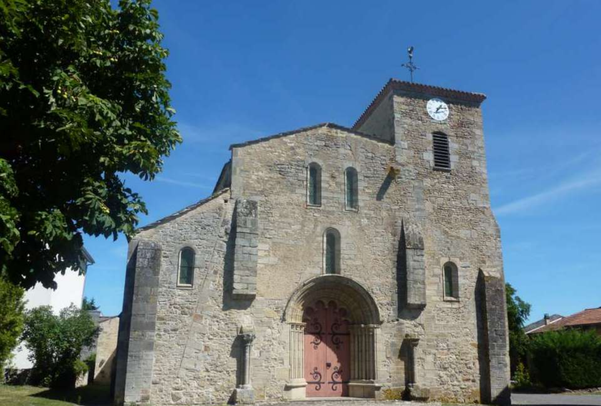
Eglise St Médulphe de St Myon, sa façade occidentale