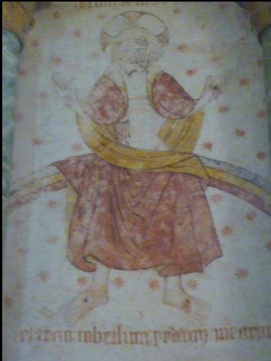
Christ montrant ses plaies