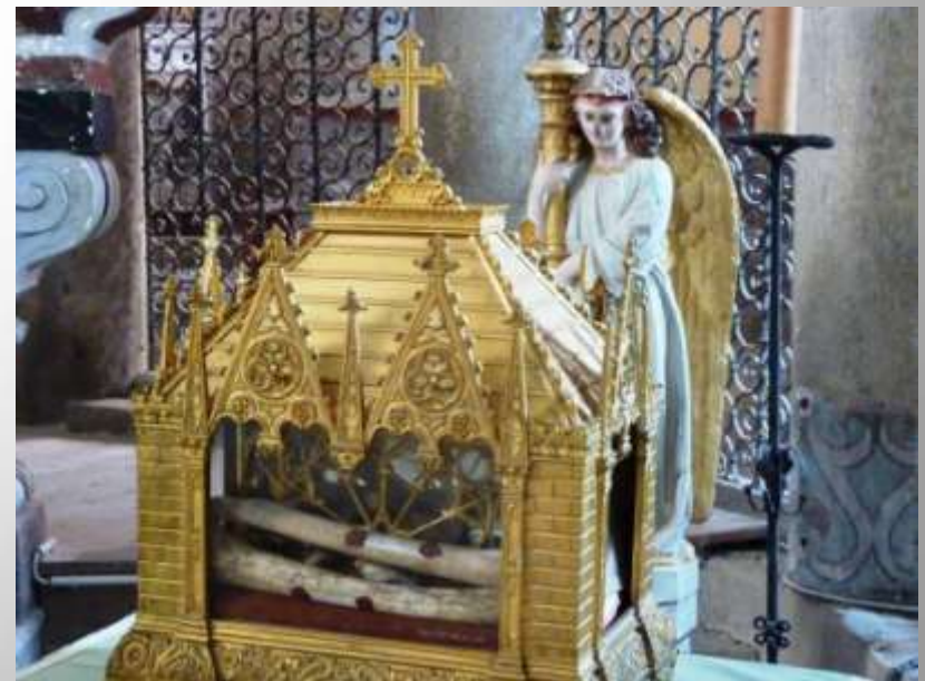
Châsse des reliques de Ste Vitaline