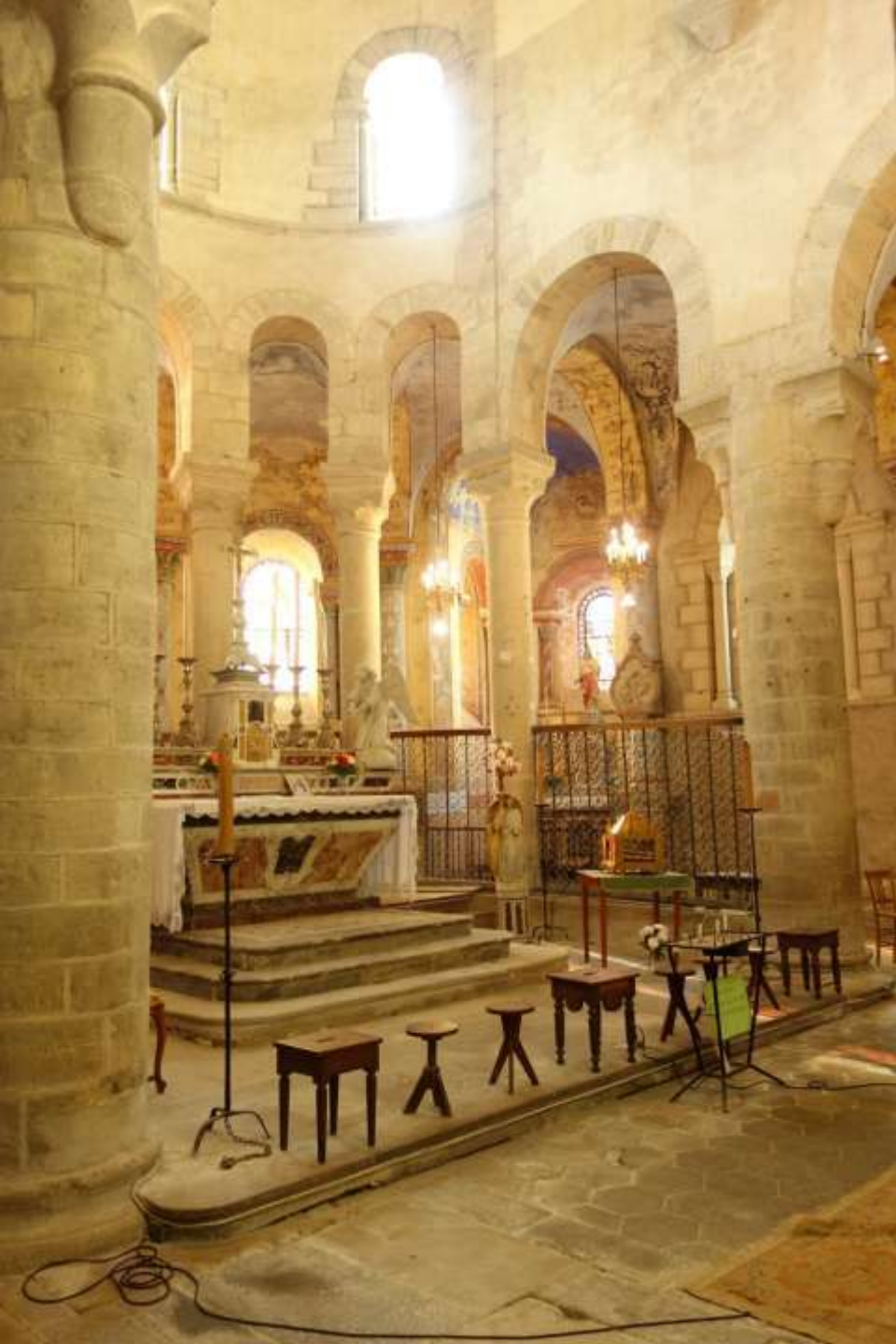
Le chœur et son déambulatoire