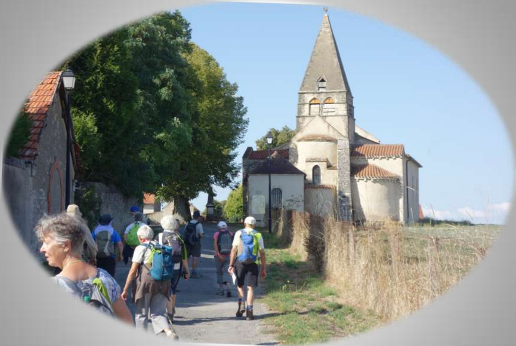
Chevet de l'église St Aignan de Bègues