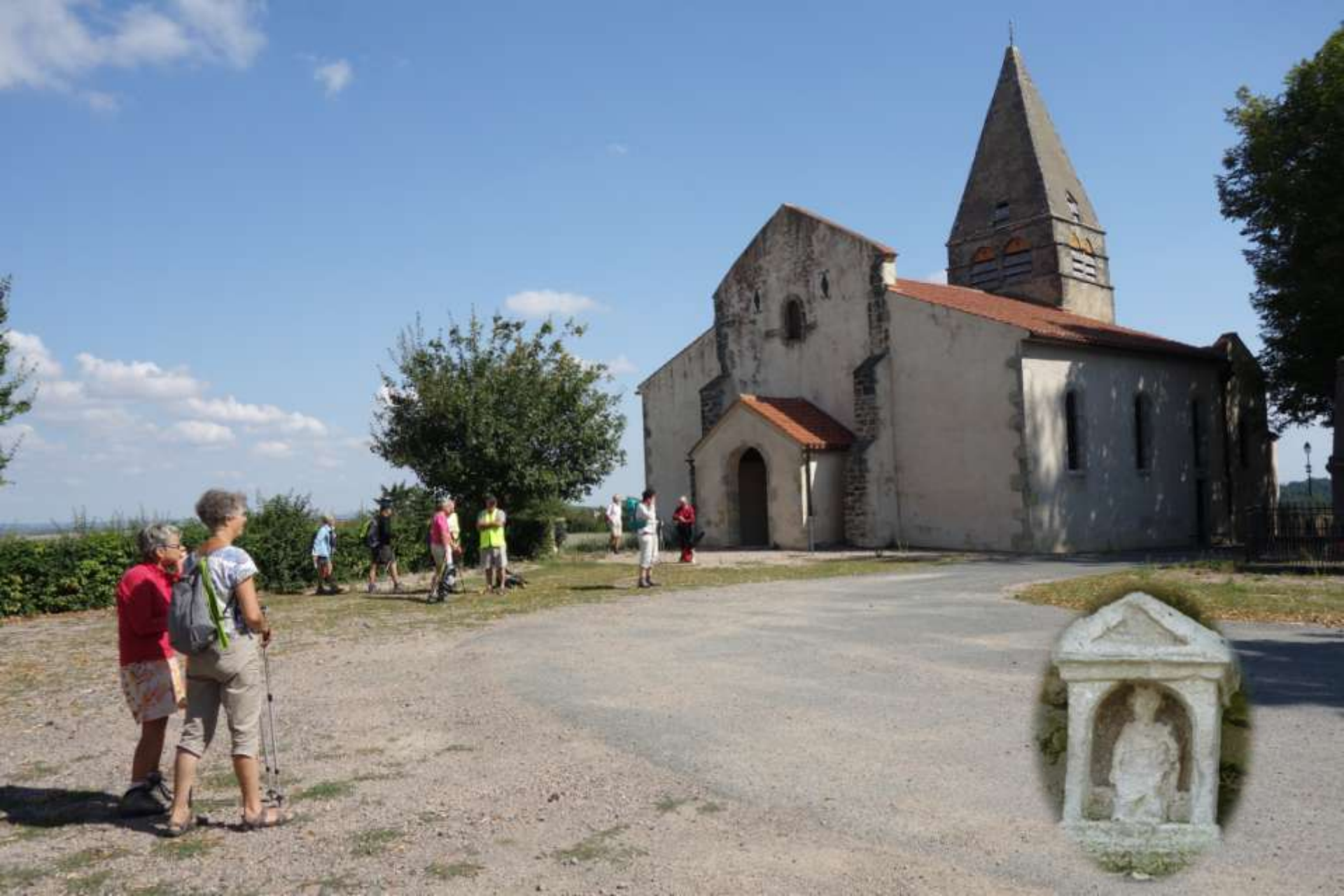
Sa flèche de pierre du XII e s. Statuette de St Aignan