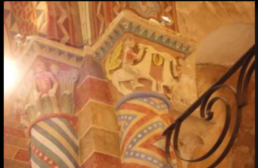
Chapiteaux du chœur