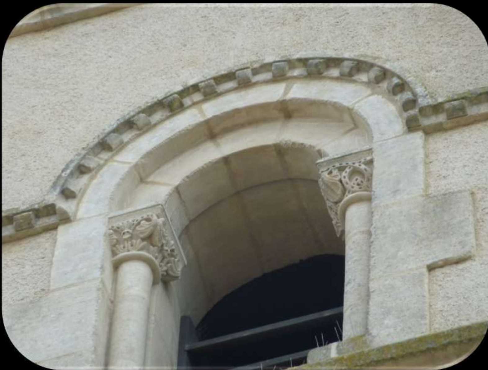
Cordon à billette