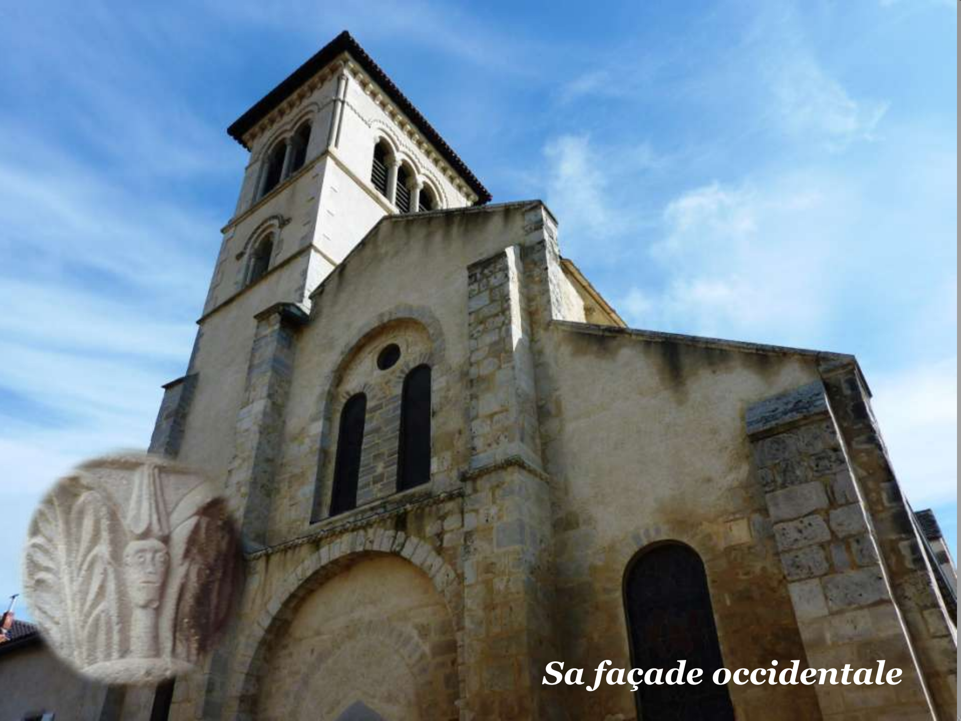
Sa façade occidentale