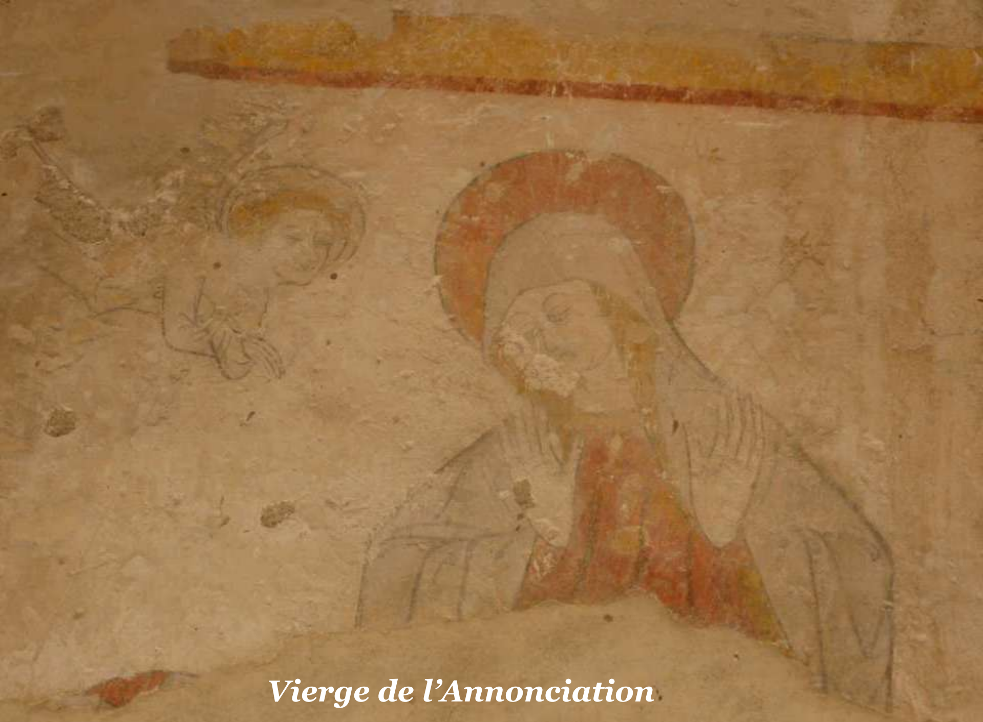
Vierge de l'Annonciation