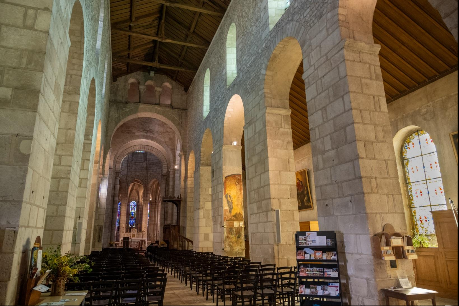
La nef et sa voûte de charpente