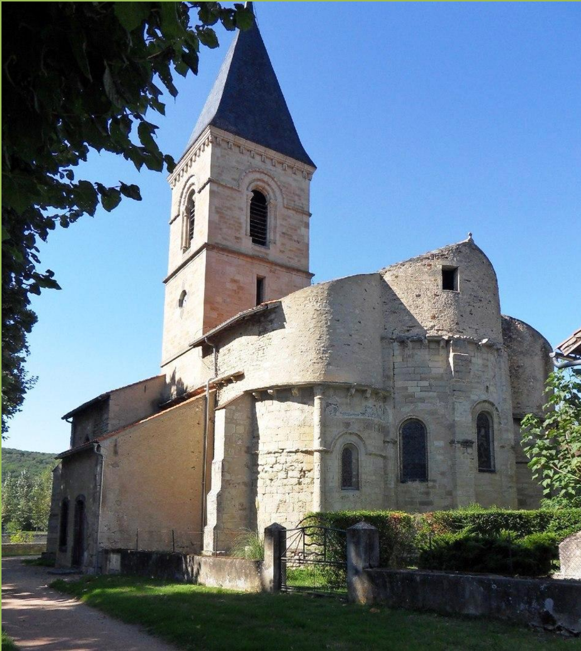
Église St-Martin de Jenzat, son chevet d'origine romane, composé d'une abside et deux chapelles orientées