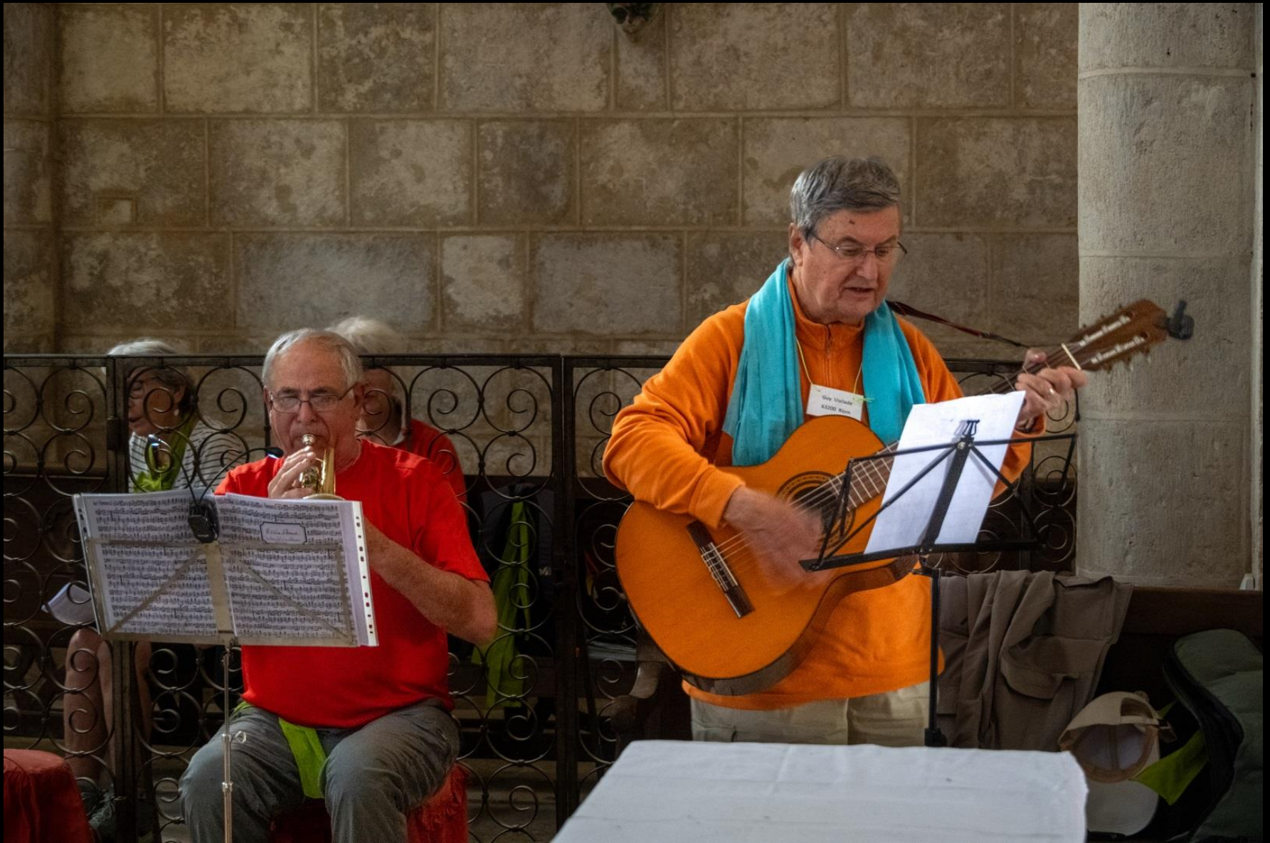
Temps de prière