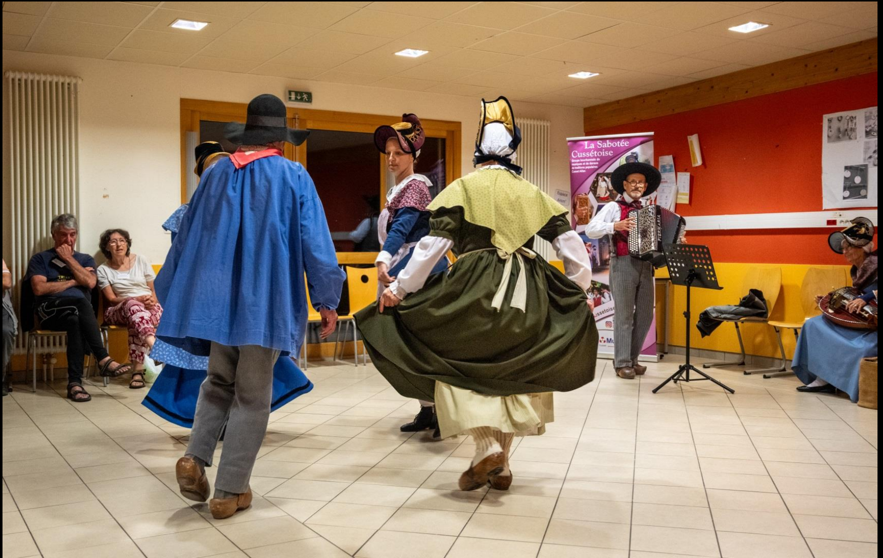
Soirée danse traditionnelle avec la Sabotée Cussetoise