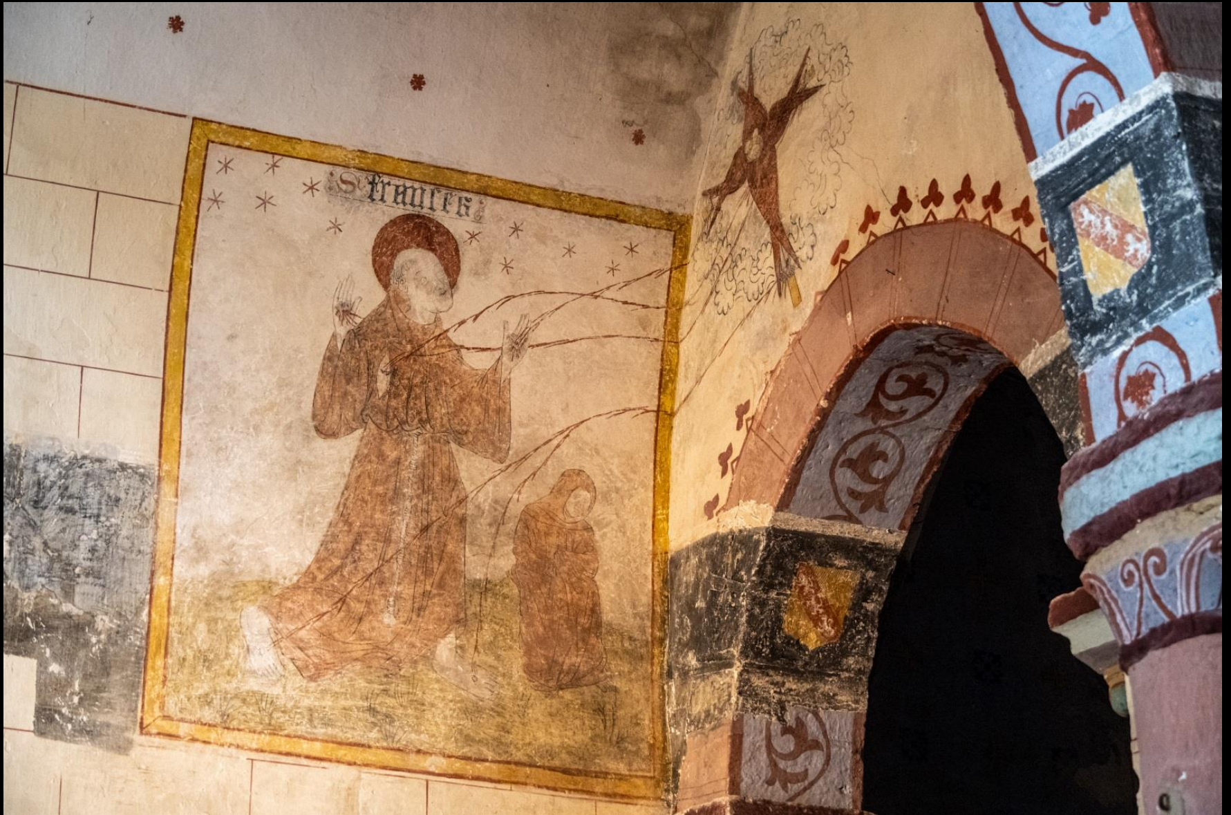
Les stigmates de saint François d'Assise