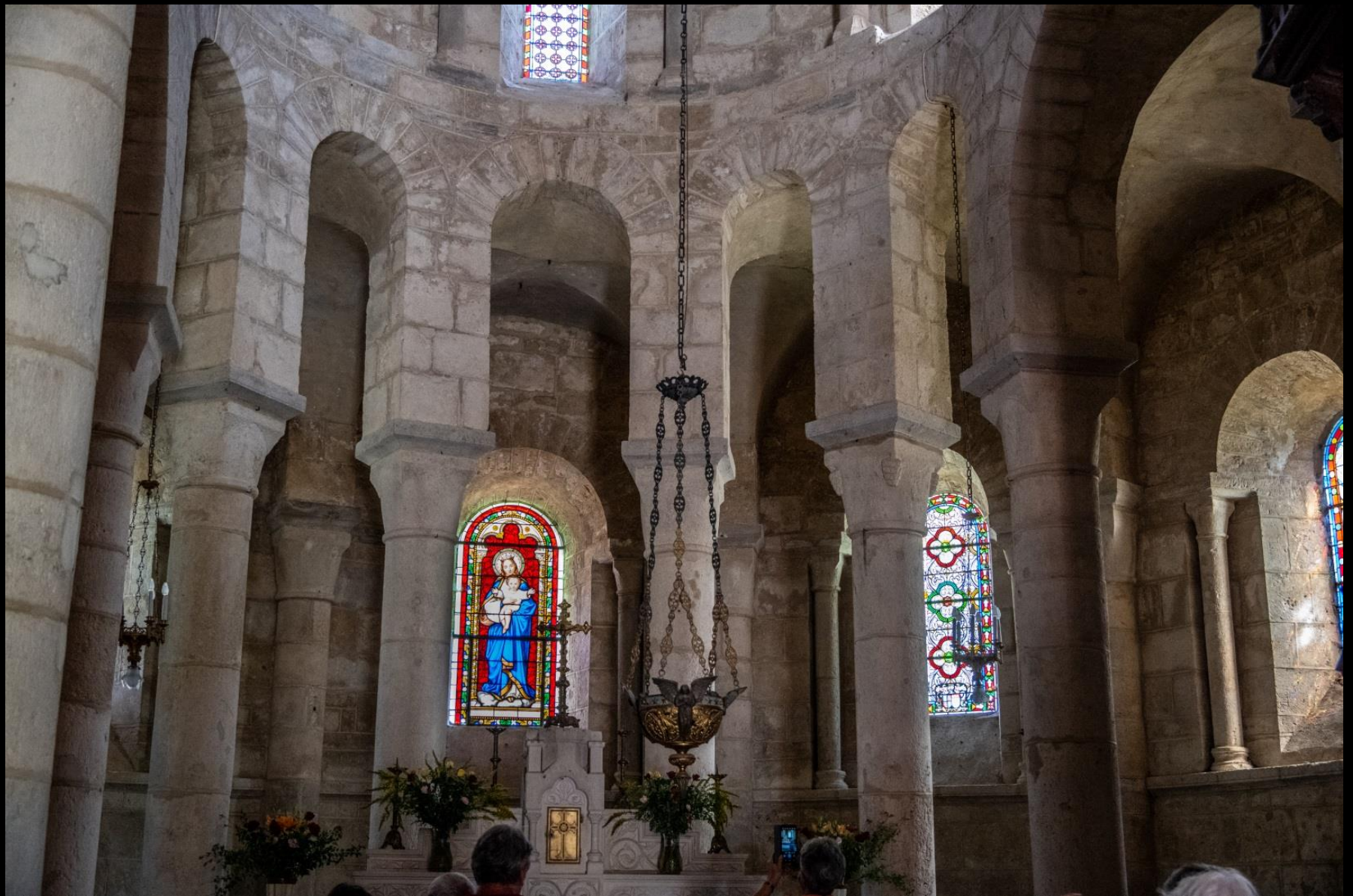
Chœur à déambulatoire