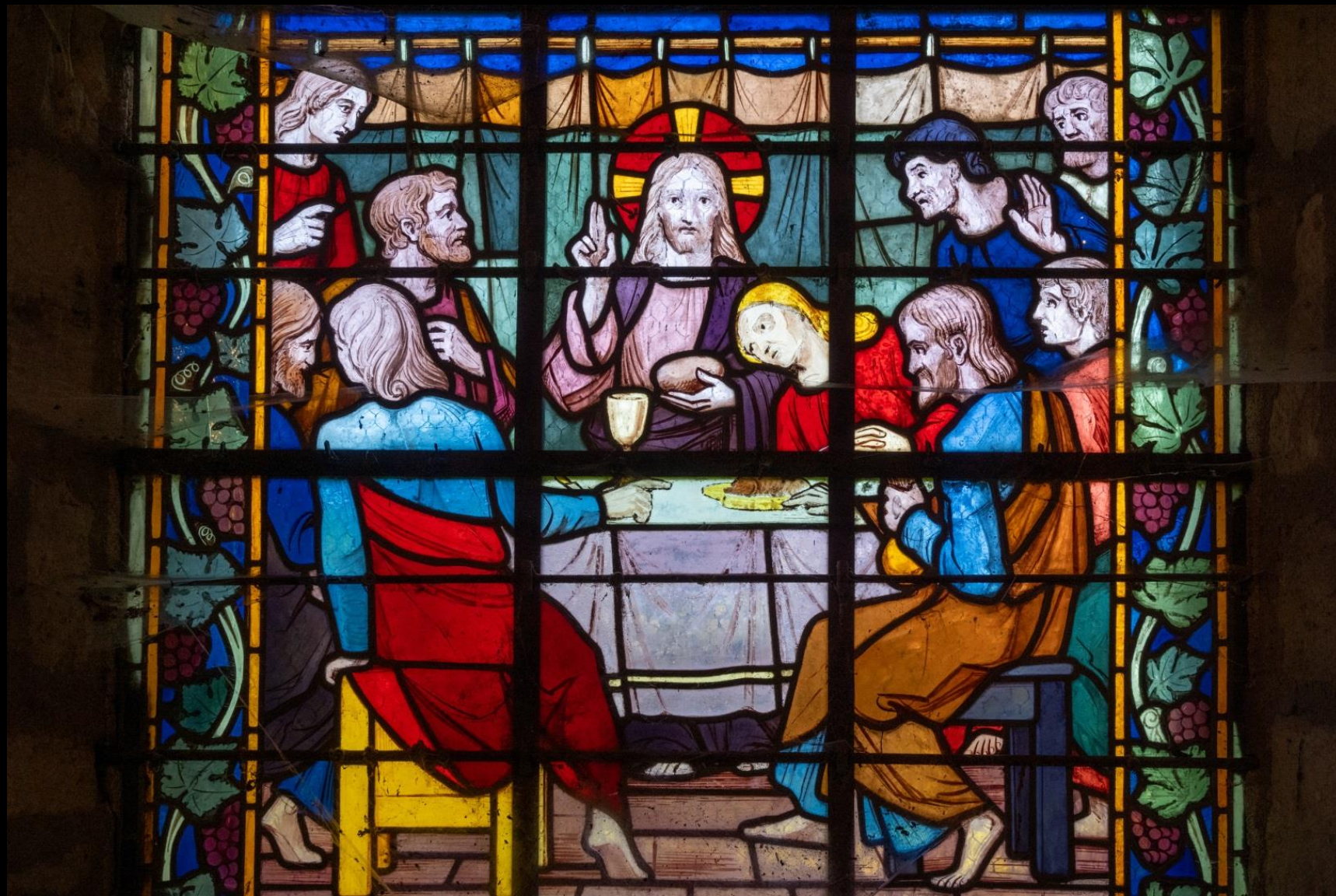
La Cène, vitrail de Tournel, 1931