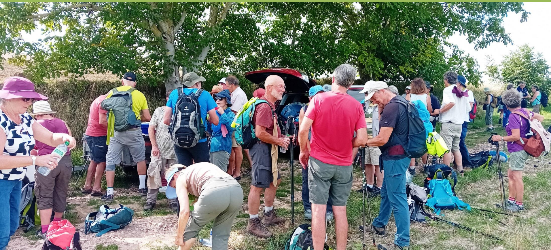
Les bâtons sont au repos Pause ravitaillement