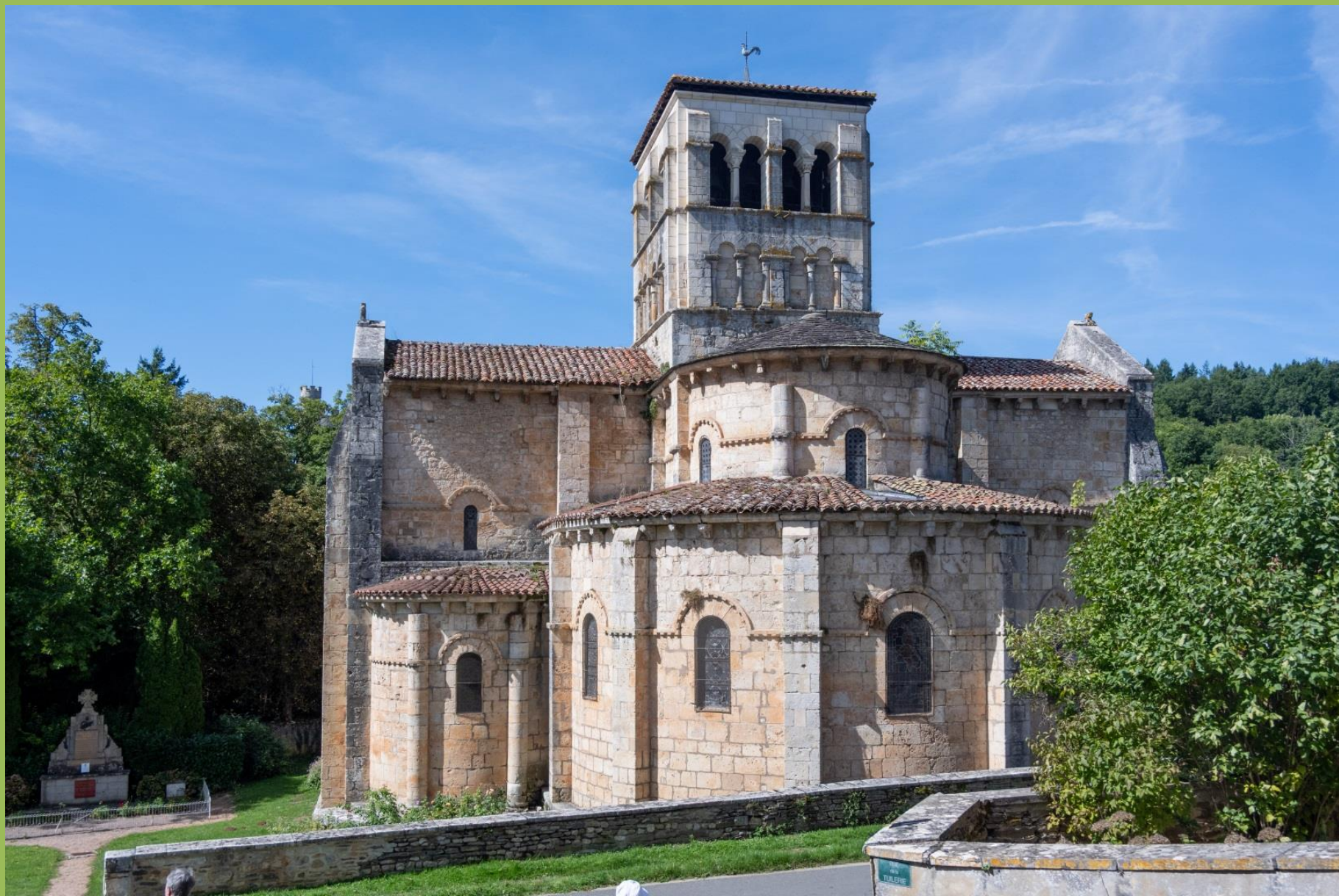
Église Sainte-Croix de Veauce