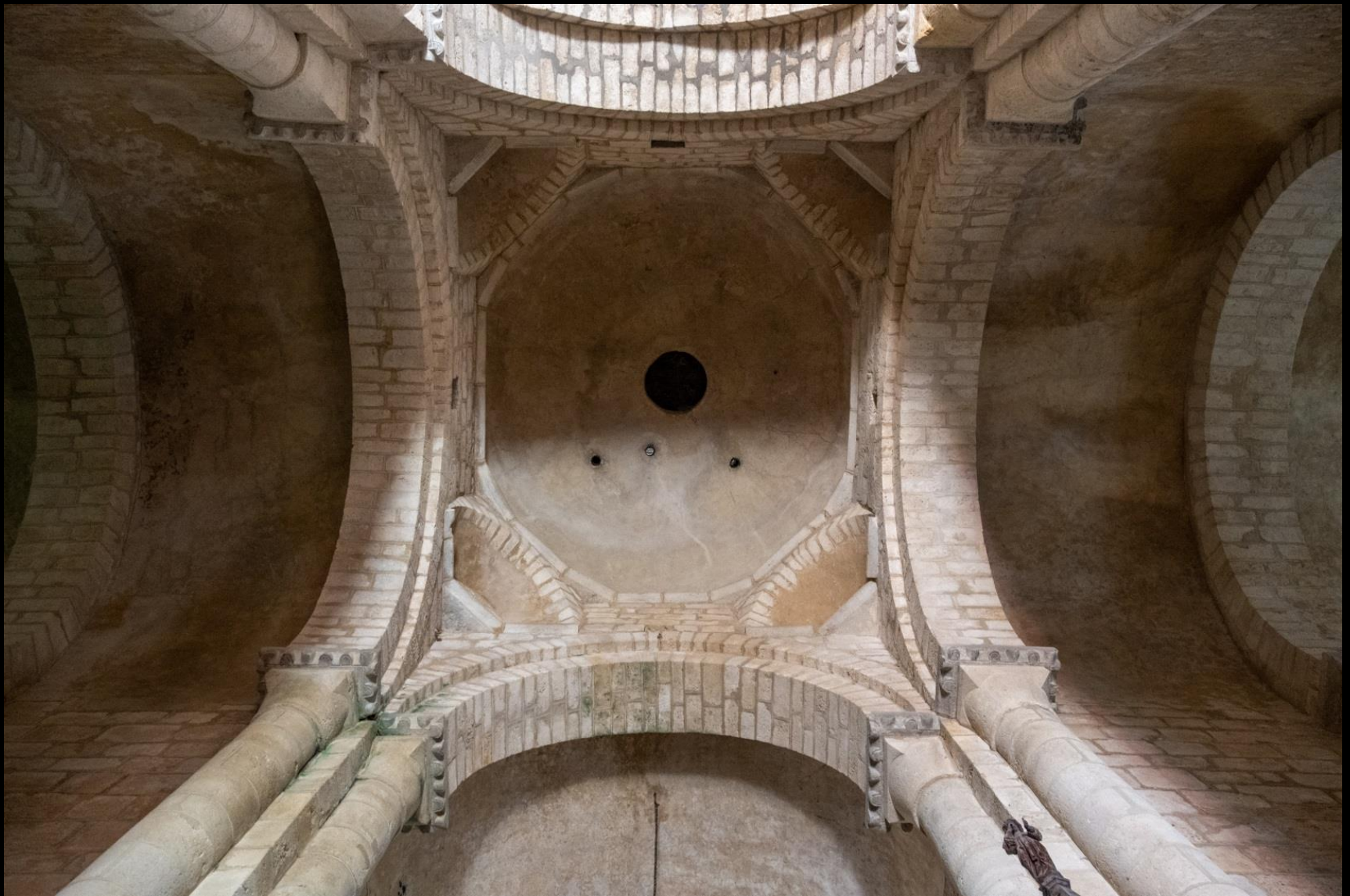
Coupole sur trompes à tablettes