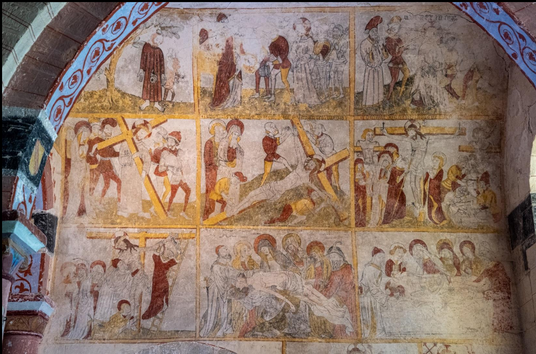
Le cycle de la Passion