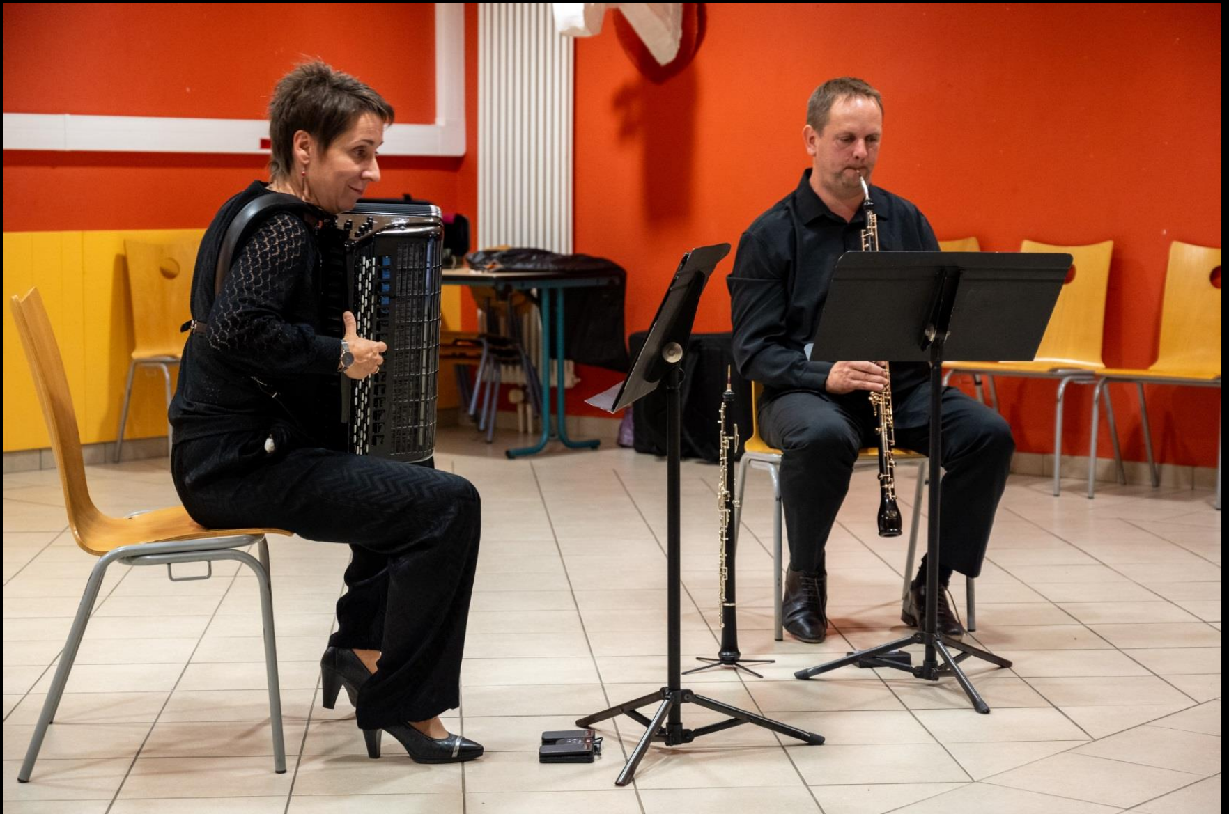
Concert Duo accordéon et hautbois