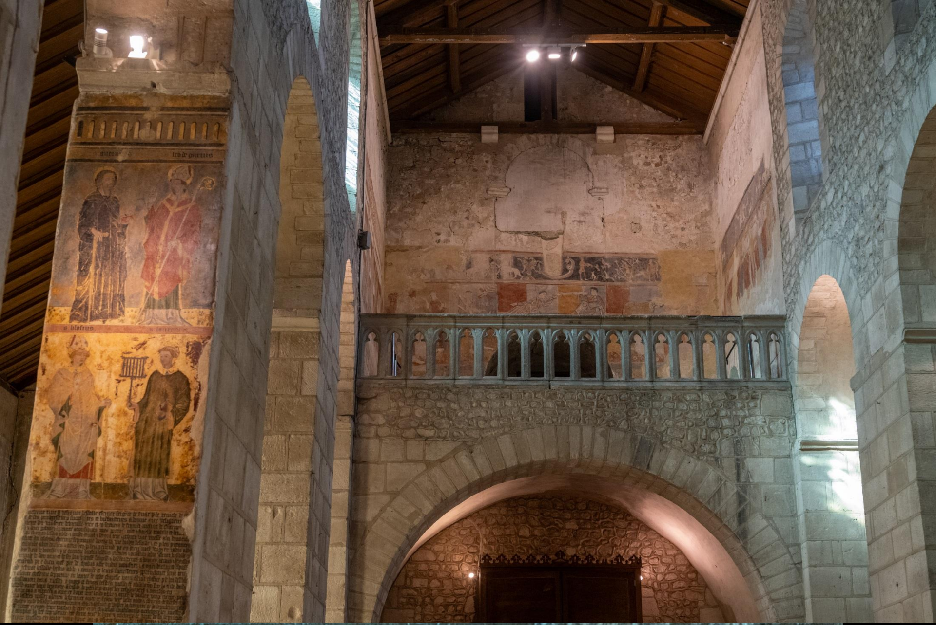
Tribune et ses peintures romanes