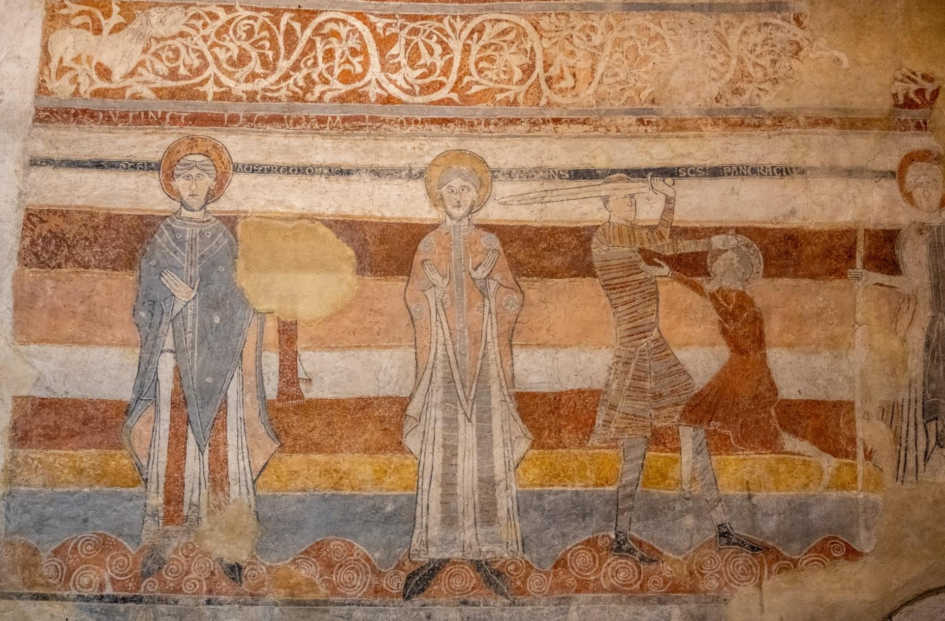
Le martyre de saint Pancrace