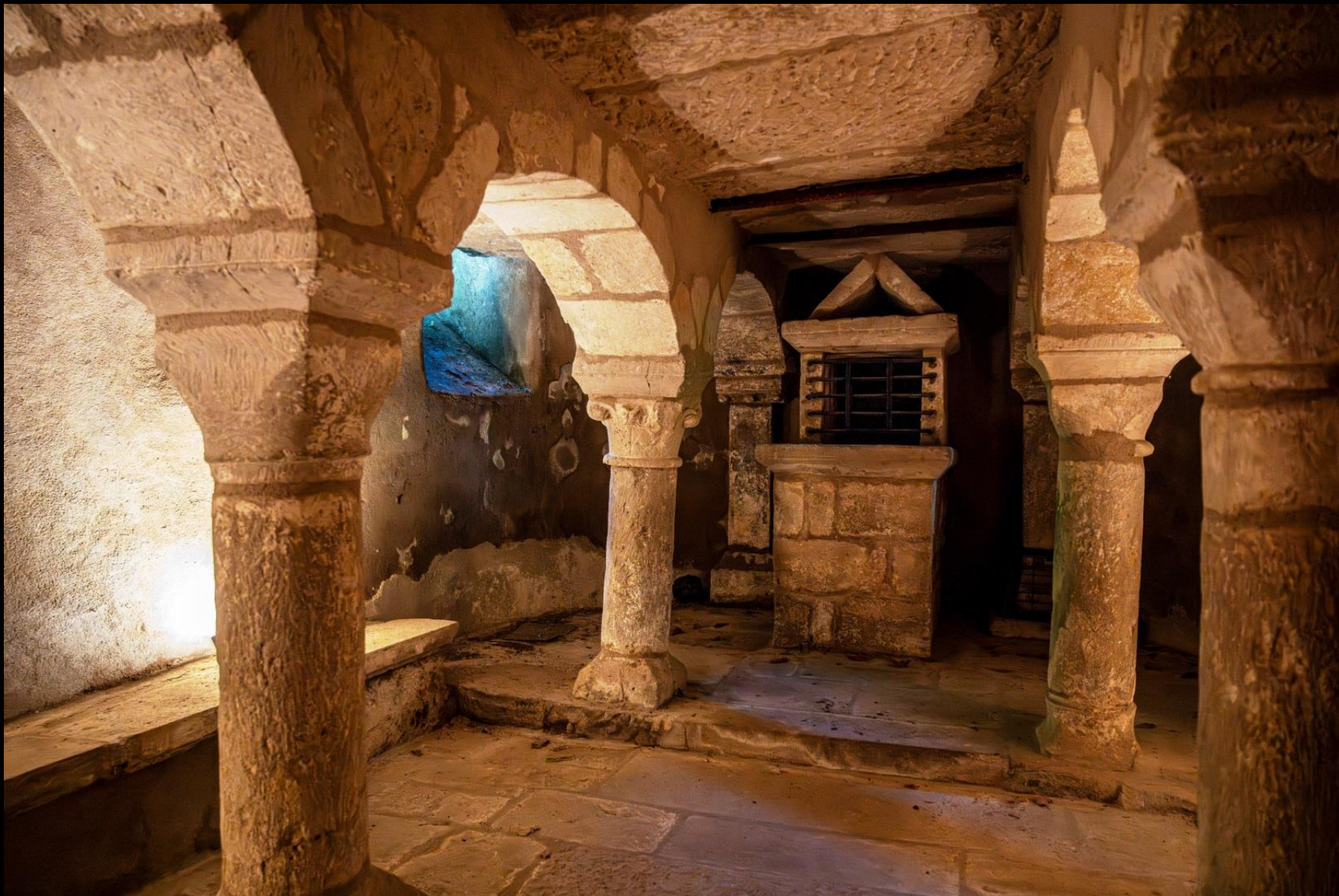
Crypte et son autel primitif avec reliquaire, X e siècle. Dédiée au moine saint Mesmin de l'abbaye bénédictine de Menat, puis à saint Maurice