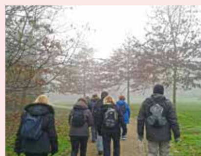
Marche douce avec Sports Loisirs Santé.

Plus d'infos sur le site www.sls-nsr.fr Contact : 03 27 81 60 30