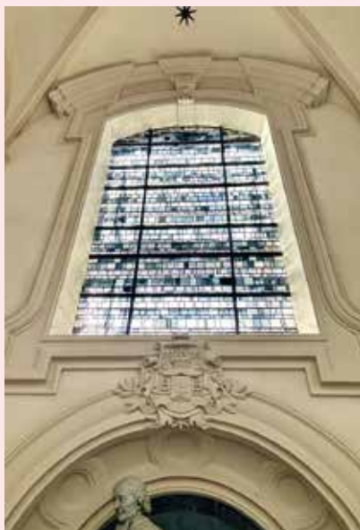
Un vitrail rénové.