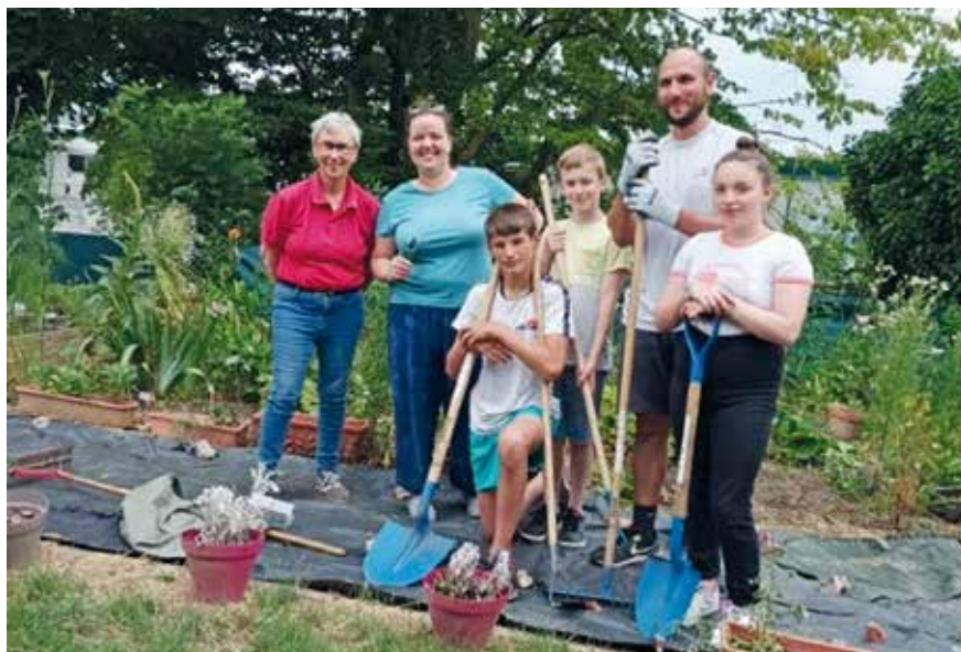
Les jardiniers en herbe.

Pour garder la forme, il faut être bien à la fois dans son corps et dans sa tête, c'est-à-dire pouvoir partager, se prendre en main, savoir être à l'écoute de soi et des autres. C'est la raison d'être du Centre social Saint-Roch que de répondre aux besoins des quatre cents personnes qui en poussent la porte chaque semaine.