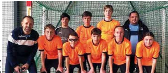
L'équipe qualifiée en Futsal (foot en salle), niveau 4/3.