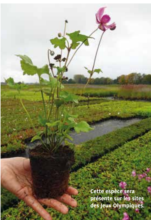
Cette espèce sera présente sur les sites des Jeux Olympiques.