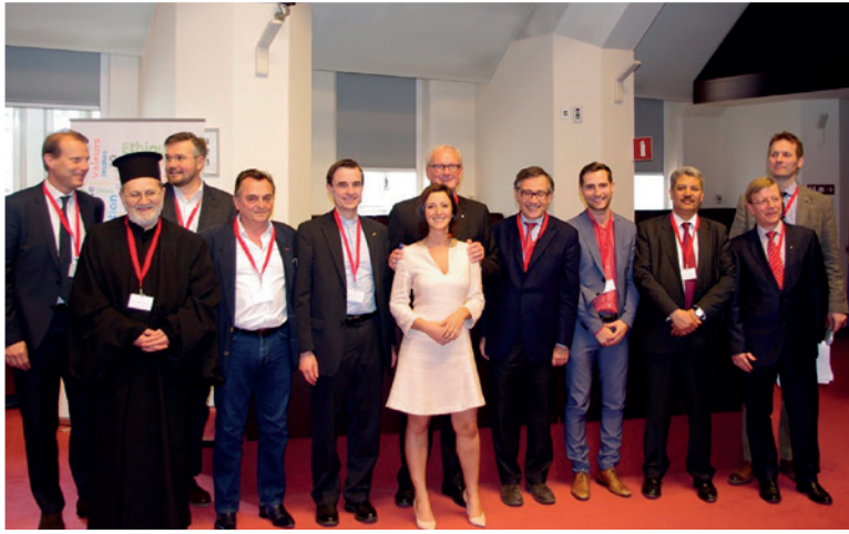
Les participants aux colloques, signataires de la Déclaration. Photo prise le 31 mars 2017 au Sénat de Belgique. De gauche à droite: